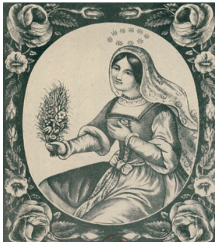
Sainte Rosalie, Bernasconi, 1852. Bibliothèque municipale de Lyon.

Des collectionneurs privés de Lyon et Strasbourg nous ont également confié leurs œuvres.