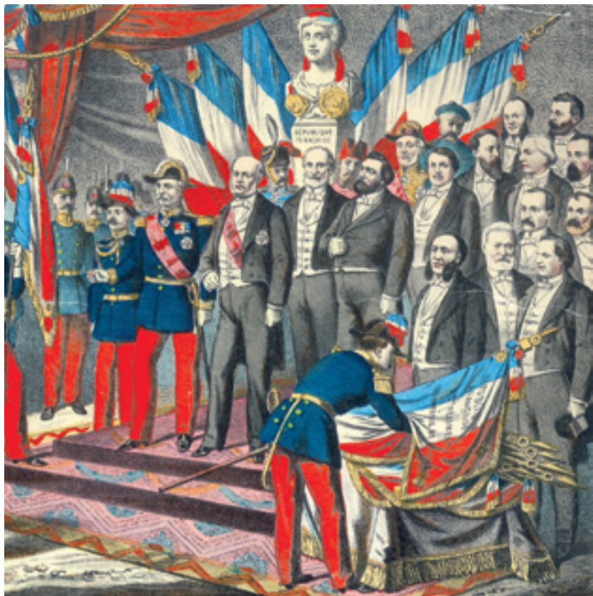
Distribution des drapeaux, l'armée prête serment, Bernasconi, 1875. Musées Gadagne.