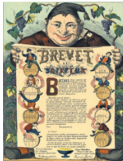
Le Brevet de Soiffeur, Bernasconi frères Éditeurs, Lyon, vers 1875. Musées Gadagne.

tout à fait lumineuse. Vous découvrirez les estampes grâce au faisceau délicat de torches à led. Impossible de manquer les détails parfois très minutieux de certains petits formats, tandis que, caressées par la lumière, les couleurs chantent ! Merci à l'entreprise Teissier qui nous offre ces torches et permet ainsi aux visiteurs une visite peu ordinaire.