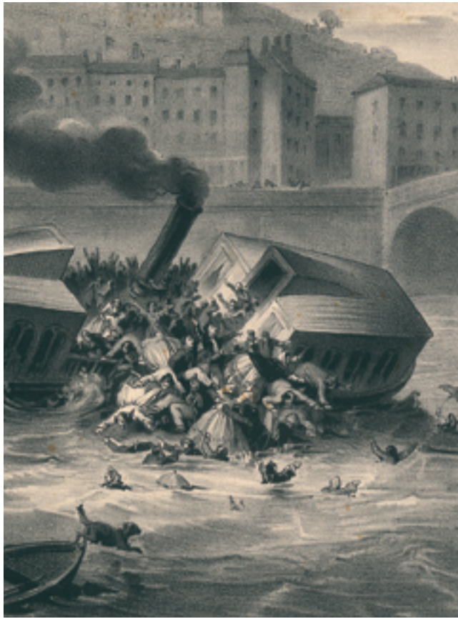
Catastrophe arrivée à Lyon sur la Saône le 10 juillet 1864, Gadola, Lyon, 1864.