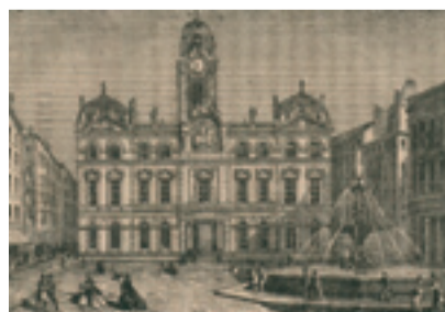
L'Hôtel de ville de Lyon, Gadola, 1860. Bibliothèque municipale de Lyon, Fonds Chomarat.