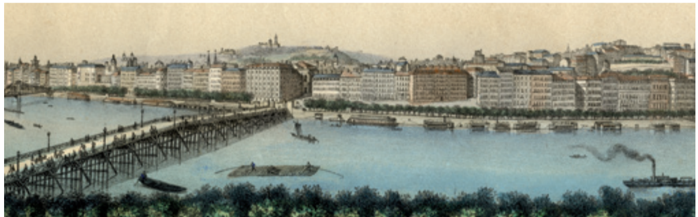
Panorama des Quais du Rhône. Vue prise du Café de Paris, rive gauche du fleuve, Gadola. Musées Gadagne.