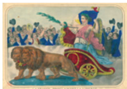
La France proclamant la Liberté, Gadola. Bibliothèque municipale de Lyon.

Vous souhaitez recevoir les informations des Amis du Musée de l'imprimerie et participer à toutes les activités organisées? Vous pouvez les contacter à amismuseeimprimerielyon@orange.fr