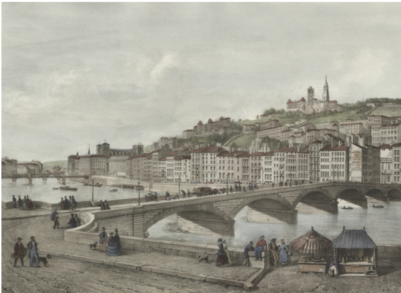
Lyon. Vue de la Côte de Fourvière prise au-dessus du Pont du Change, Bernasconi Frères, Lyon, [1856].